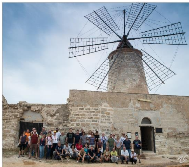
Salina Calcara 13 settembre 2018